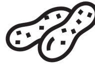
földi mogyoró erdnüsse peanuts