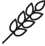
glutén gluten gluten