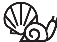
puhatestű mollusken molluscs