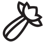
zeller sellerie celery