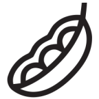
szója soja soy

Ein Allergen ist eine Substanz, die über Vermittlung des Immunsystems Überempfindlichkeitsreaktionen (allergische Reaktionen) auslösen kann.