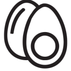
tojás ei egg

Bizonyos ételek tartalmaznak olyan fehérjéket, amelyek arra érzékeny személynél allergiás tünetet váltanak ki. A leggyakoribb a tej-, tojás-, és mogyoró-allergia.