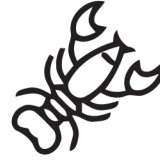
rák krabbe crab